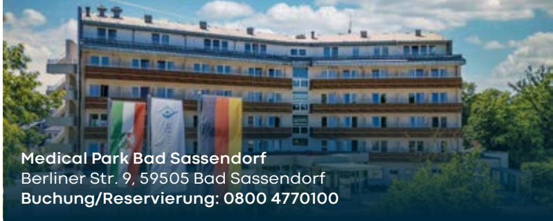
Medical Park Bad Sassendorf Berliner Str. 9, 59505 Bad Sassendorf Buchung/Reservierung: 0800 4770100