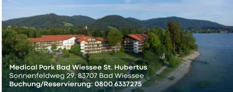
Medical Park Bad Wiessee St. Hubertus Sonnenfeldweg 29, 83707 Bad Wiessee Buchung/Reservierung: 0800 6337275