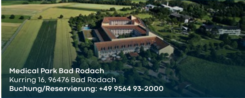
Medical Park Bad Rodach Kurring 16, 96476 Bad Rodach Buchung/Reservierung: +49 9564 93-2000