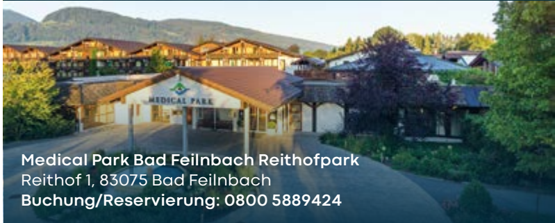
Medical Park Bad Feilnbach Reithofpark Reithof 1, 83075 Bad Feilnbach Buchung/Reservierung: 0800 5889424