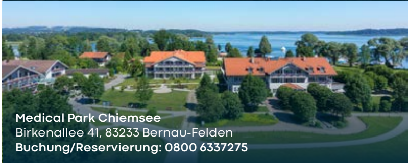
Medical Park Chiemsee Birkenallee 41, 83233 Bernau-Felden Buchung/Reservierung: 0800 6337275