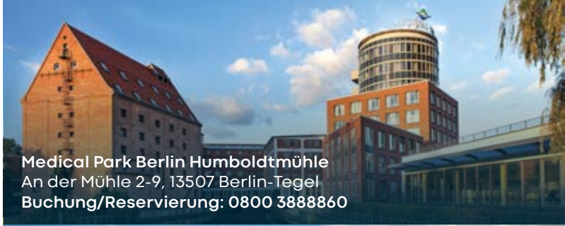
Medical Park Berlin Humboldt-mühle An der Mühle 2-9, 13507 Berlin-Tegel Buchung/Reservierung: 0800 3888860