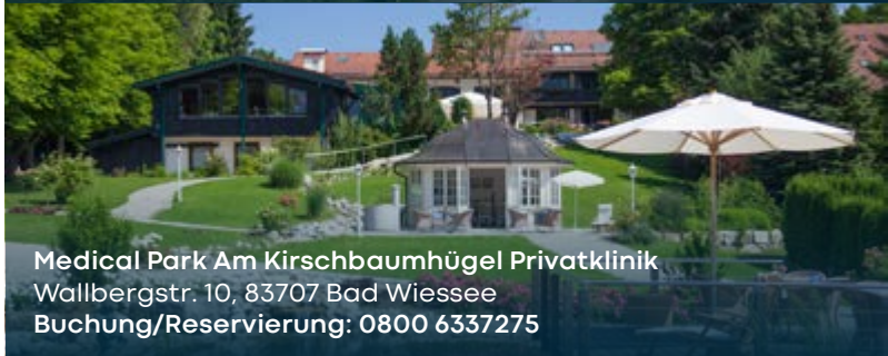
Medical Park Am Kirschbaumhügel Privatklinik Wallbergstr. 10, 83707 Bad Wiessee Buchung/Reservierung: 0800 6337275